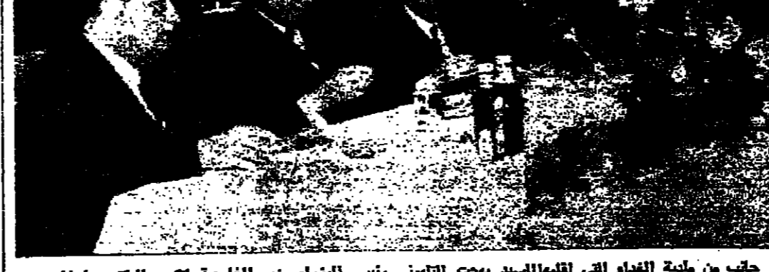
جانب من ملية الفداء التي اقامها السيد بهجت القلوني رئيس الوزراء وزير الخارجية تكريم الدكتور يارنغ

خاتمة يا صاحبي ! وتنادي : نحن هنا ! القديس لنا ! نبوعنا في العار .. ما لم تفعل عيوننا من طحالب العتمة التي ملانها اجيالا . وتفتحنا من جديد على واقع نحن وحدنا صاعقه لانا وحدنا اصحابه وسادته وابناؤه وموتروه نبوعنا هي العار .. ما لم تطهر طوبنا من الانصاف بوحل الشبوات الكريهة وتملاها ايماننا كالمسيح القديسين والشهداء .. ويا صاحبي لقد بكى شعراؤنا طويلا واستبقوا الاطلال والدمين والساحل السليب .. لقد بكوا طويلا .. وكبرا وقد ان بكيم الشمس والفتاة ، ان يرفضوا اليكاه . وان يطالبوا بالمثل الذي : لهم طريق الغد قيسا من نور : لا نوبنا من دموع « امين شكار »